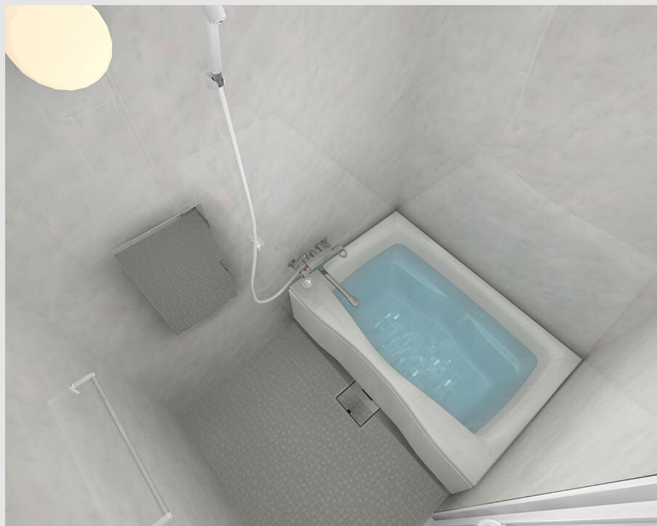
CG合成によるイメージ画像です。