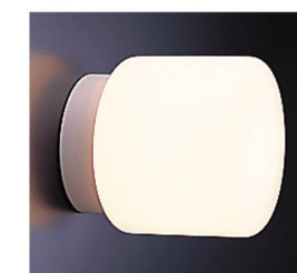
円筒形照明(白熱灯) LW-C6-4A